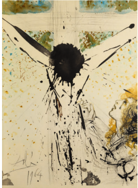
Maria Magdalena unter dem Kreuz